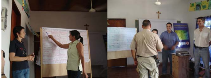
Foto 3: Ponencia de participante para debate Foto 4: Entrega de certificado a participantes

SE ADJUNTAN EN FORMATO DIGITAL EN CD REGISTRO FOTOGRAFICOS DE LOS EVENTOS Y GRABACIONES DE LAS ENTREVISTAS CON LOS MEDIOS DE PRENSA LOCAL.